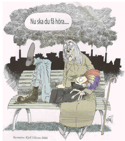
Illustration: Kjell Nilsson-Maki

HÁSKÓLI ÍSLANDS FÉLAGSVÍSINDAÐEILD FÉLAGSRÁÐGJAFARSKOR